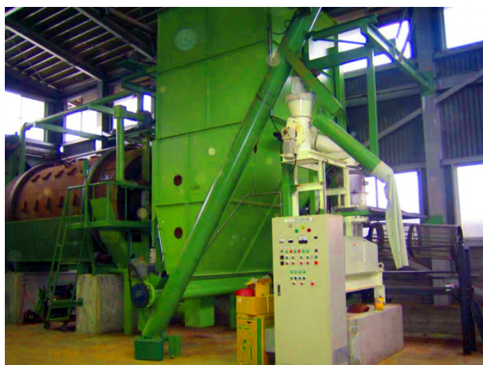
ペレット製造プラント（山梨県）