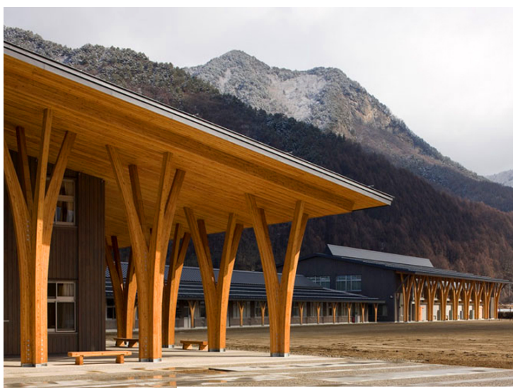
川上村立川上中学校（長野県）